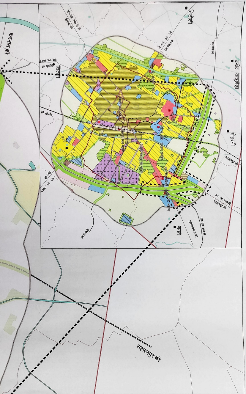
मुलफकानगर विकास प्राधिकरण बोर्ड, मुलफकानगर।